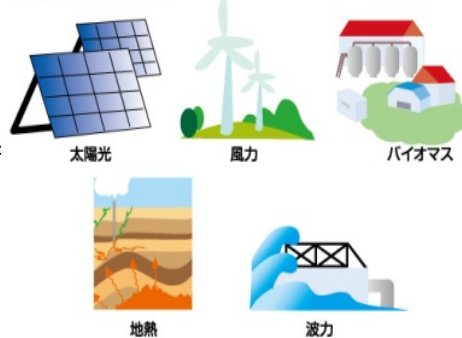
再生可能エネルギー(一例)

配慮する様に求めました。また、煩雑な制度が事業者の過度な負担増にならない様に改善も求めました。